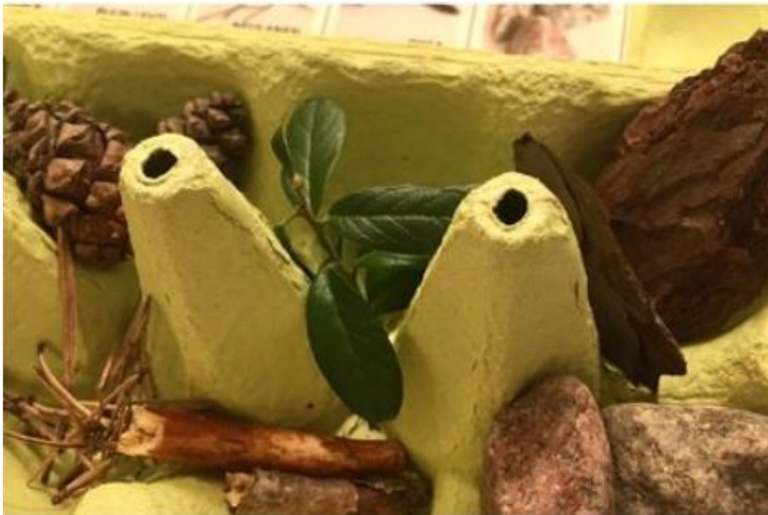
Löydettyjä luonnonmateriaaleja lokeroissaan.

Kastuneet kennot laitetaan käytön jälkeen kuivumaan seuraavaa käyttöä varten. Käytöstä poistetut keräyskennot pannaan kompostiin, mikä sopii luontoteemaan. Kerätyt luonnonmateriaalit voidaan koota lasimaljaan esille tai niistä voidaan liimata taulu.