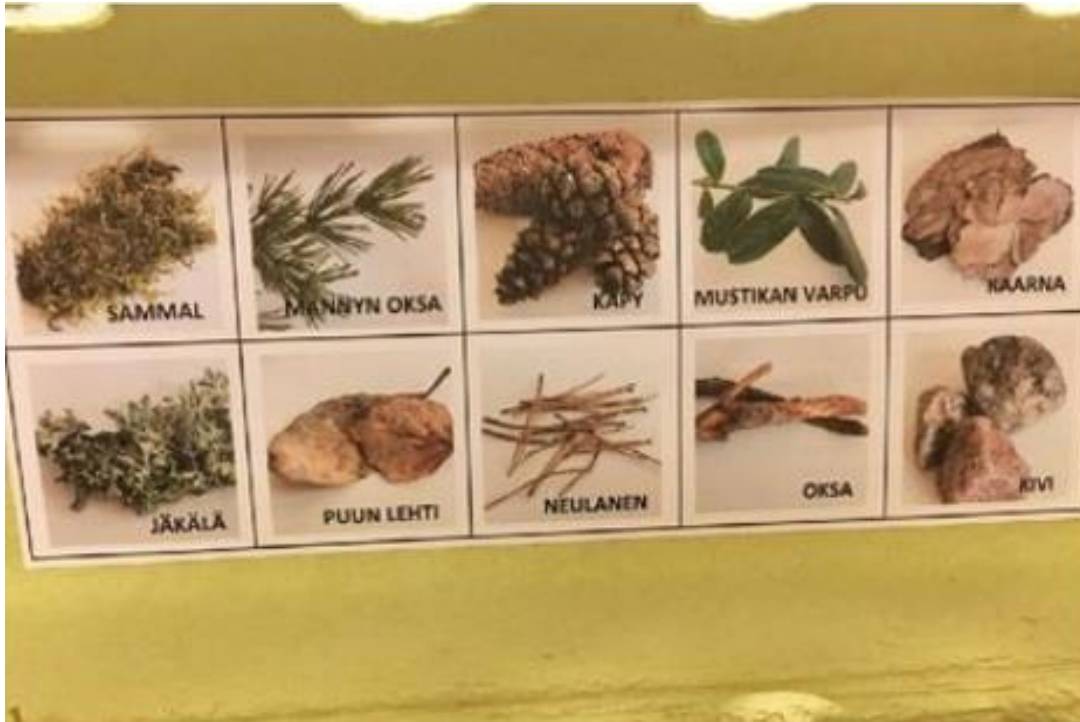
Kannen sisäpuolelle liimatut kuvat teksteineen.