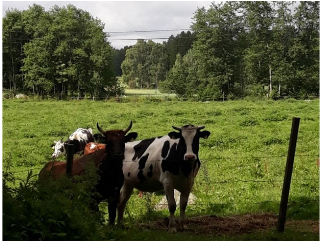
Lehmät uteliaina laitumella.

Maatilat mainostavat tapahtumia lehdissä ja Internetissä.